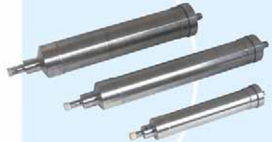
Tubular Centrifuge Rotor